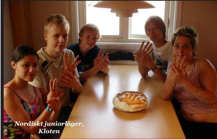
Nordiskt juniorläger, Kloten