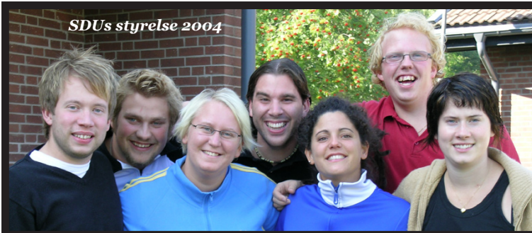
SDU's styrelse 2004