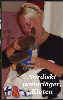
Nordiskt juniorläger, Kloten