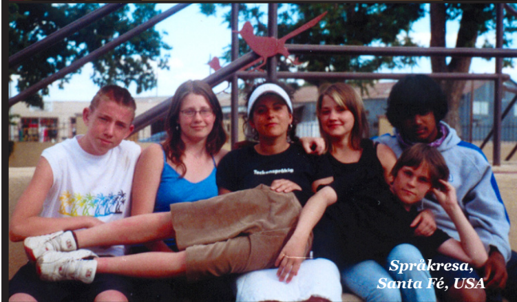
Språkresa, Santa Fé, USA