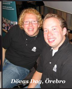
Dövas Dag, Örebro