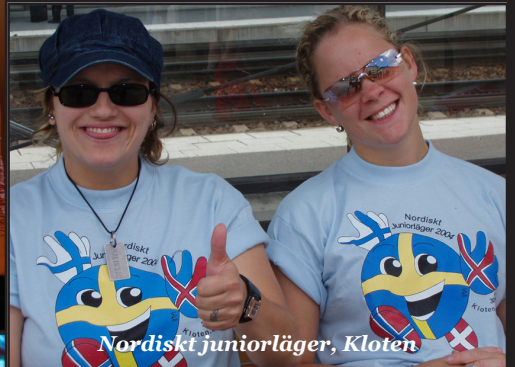
Nordiskt juniorläger, Kloten