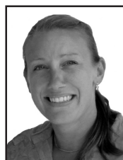
Therese Rollvén Internationell ombudsman