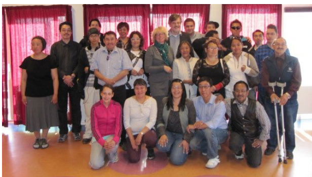
SDUF och SDR med invånarna.

Det finns bara 50 döva varav 15 är ungdomar på Grönland och transport till varandra är dyrt då man måste flyga. DNUR och DNR hade seminarium för situationen i Grönland med ministrar och viktiga namn i Grönland. Invånarna fick också berätta deras erfarenhet. Det var ett riktigt bra seminarium om situationen.