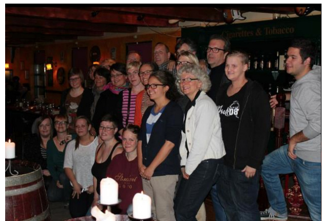
DNUR och DNR i Nuuk.

Vi utvärderade också nordiska läger som genomfördes under 2012 och diskuterades vad kunde ha förbättrats,