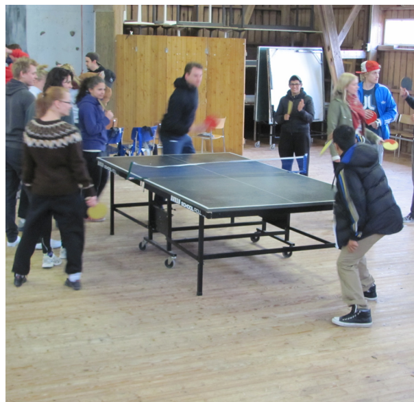
Bordtennis, frisbeegolf och klättring erbjöds, efter en lång dag sittandes behöver man röra på benen!