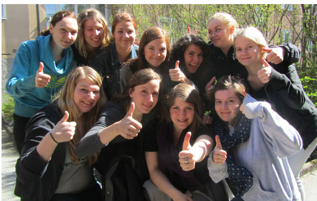
Kursdeltagare på personalutbildningen i Örebro.

Under året har lägergruppen haft två möten och utöver det har First Class använts för diskussion och beslut.