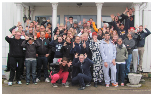
Stämmodeltagare på Ransberg herrgård.