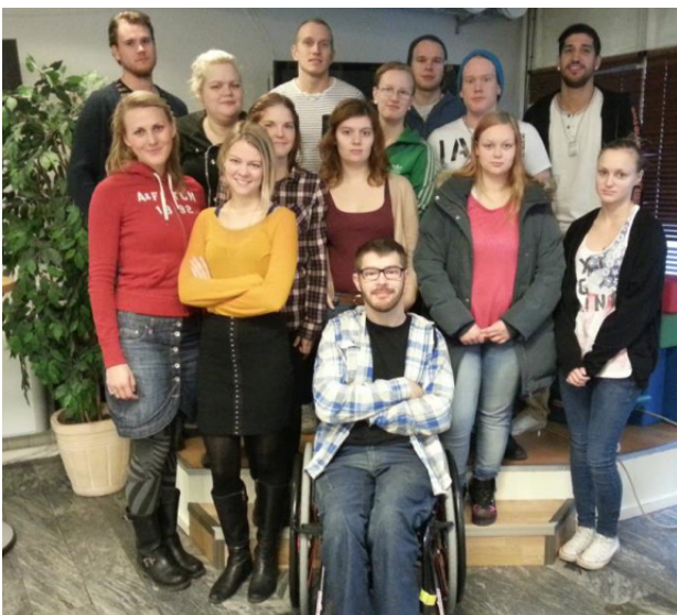
Helgens alla konferensdeltagare.