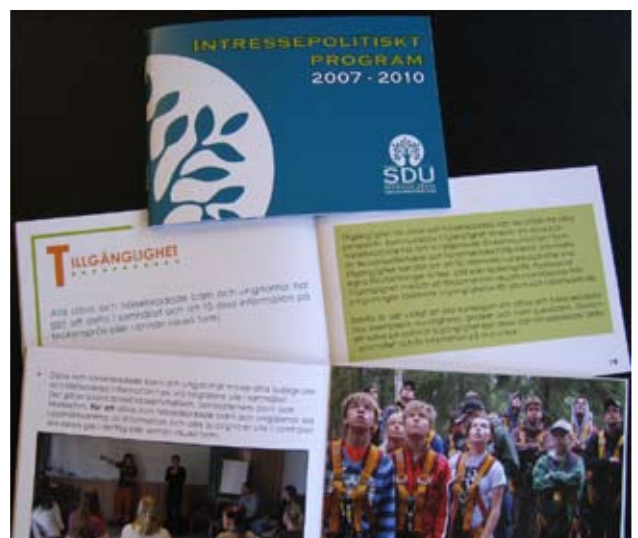
SDU:s Intressepolitiska program blev äntligen klart under november.