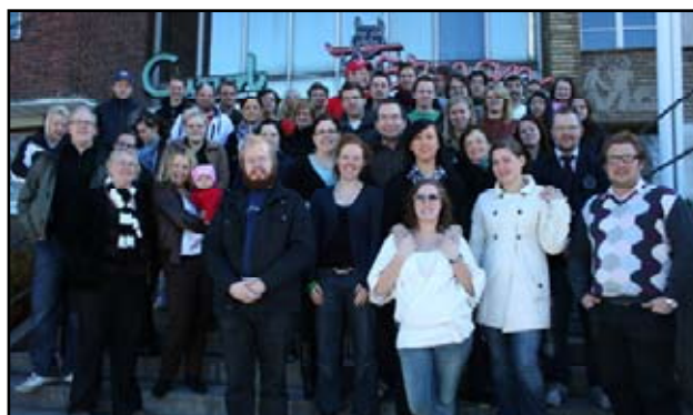
Deltagare på förbundsstämman i Oxelösund.