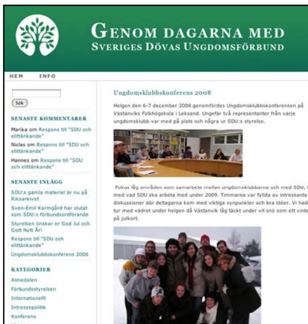
SDU:s nya blogg

Den 27 februari lanserades SDU:s nya blogg för första gången. Där skriver såväl styrelseledamöter, tjänstemän, arbetsgrupper, medlemmar och andra berörda personer inlägg om diverse saker.