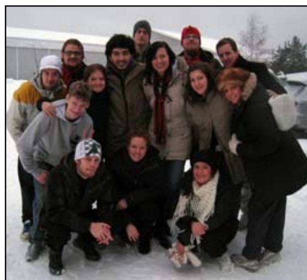
Konferensdeltagare på ungdomsklubbskonferensen i Leksand.