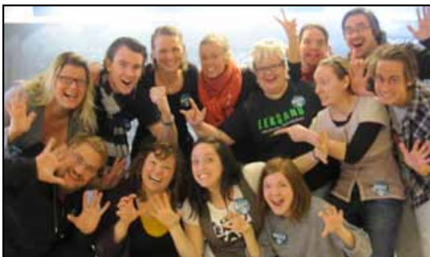
Deltagare från den första kursstegen

Meningen med att starta en sådan kurs för unga är att de får kunskaper hur man kan informera för andra som inte känner till teckenspråk och dövkultur. Efter dessa tre kurser bildade vi en grupp som vi döpte till "Unga Informatörer".