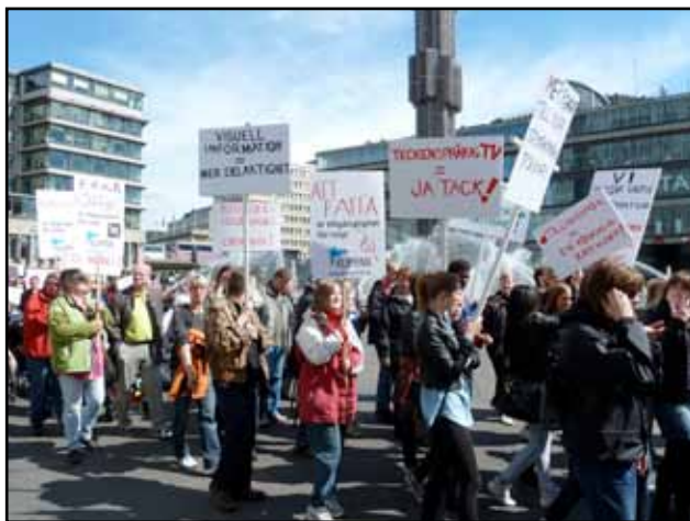
Tillgänglighetsmarschen, 29 maj i Stockholm