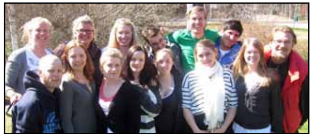
Kursdeltagarna på Personalutbildningen i Leksand