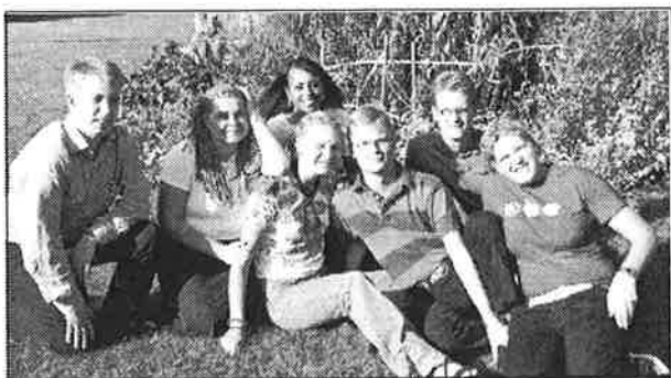
SDUs styrelse före årsstämman

Styrelsen har haft tre sammanträden under år 2000 fram till årsstämman.