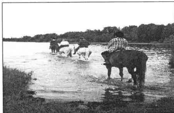
Hästintresserade ungdomar i Leksand

På Ridläger i Leksand deltog 11 deltagare, 9 tjejer och 2 killar mellan 10-17 års ålder och fyra ledare, två ridlärare och två praktikanter från Härnösands folkhögskola.