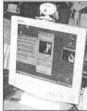
Bildtelefon via bredband