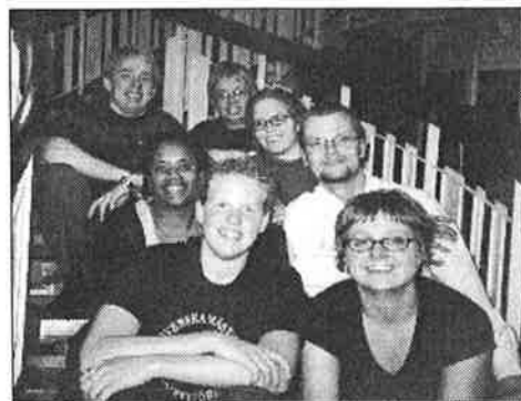
SDUs styrelse efter årsstämman