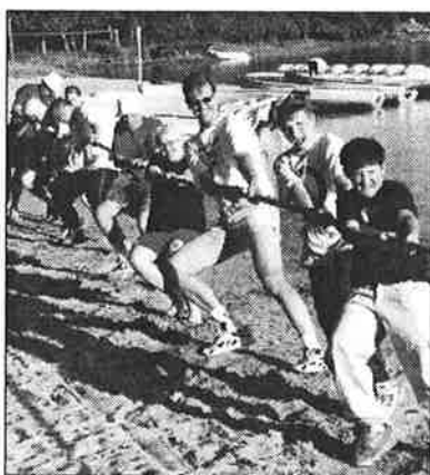
Ungdomar på Åland

SDU och SDI (Sveriges Dövas Idrottsförbund) samarbetade för första gången med lägerverksamhet för 13-17 åringar.