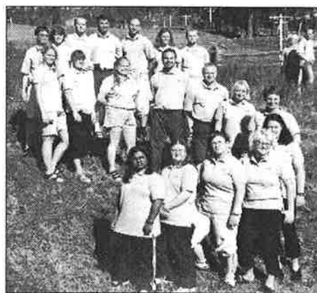
Svenska gruppen deltog i Idre fjäll

Det var 108 personer från fem länder; Finland, Danmark, Island, Norge och Sverige som deltog i Nordiskt Ungdomsläger i Idre.