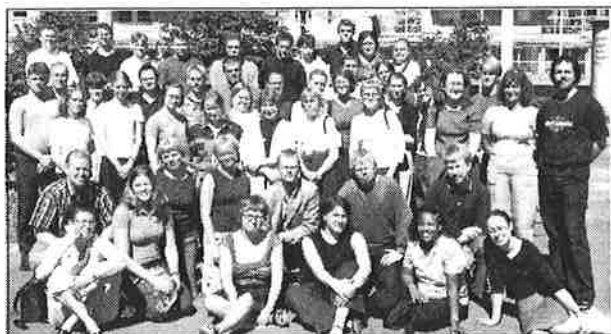
Ungdomar från Sverige som deltog på SDUs årstämma i Göteborg.