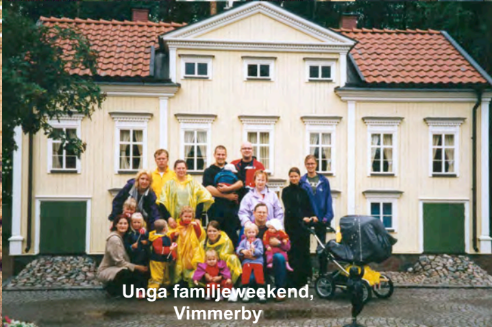
Unga familjeweekend, Vimmerby