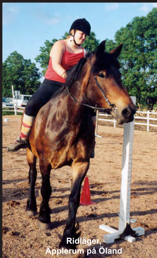
Ridläger, Äpplerum på Öland