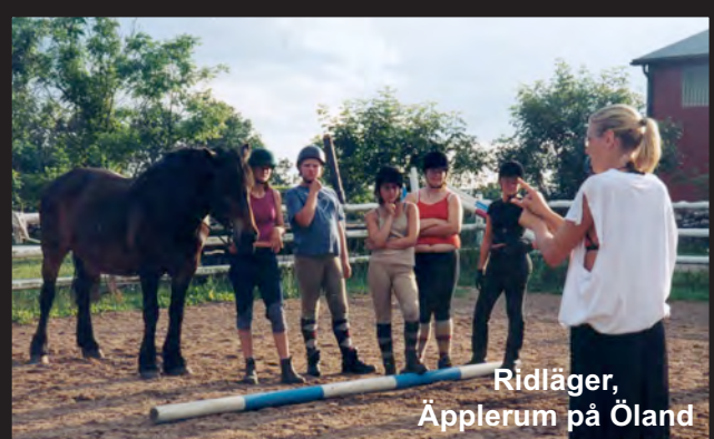
Ridläger, Äpplerum på Öland