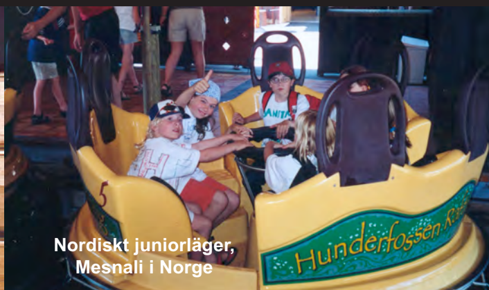
Nordiskt juniorläger, Mesnali i Norge