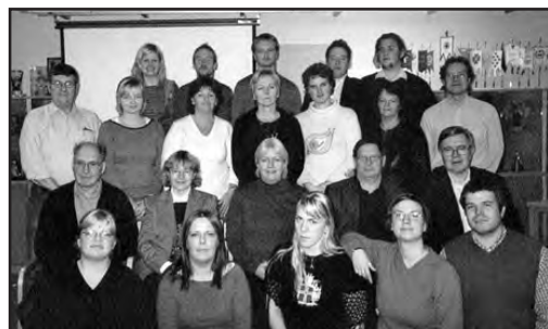
Representanter från Nordiska länder på DNR och DNUR möte i Helsingfors, Finland

DNUR diskuterade även hur vi kan förbättra samarbetet gällande lägerverksamheten. Det beslöts att ett förslag på en handboken för arrangemang kring nordiska läger skall arbetas fram under år 2004. Vidare beslöts att DNUR skall ha två möten per år enligt DNRs mötesplan. Det innebär att nordiska ungdomsmöten i dess gamla form avskaffas fr.o.m år 2003.