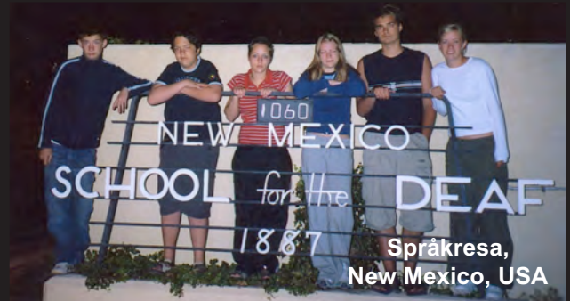
Språkresa, New Mexico, USA