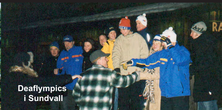
Deaflympics i Sundvall