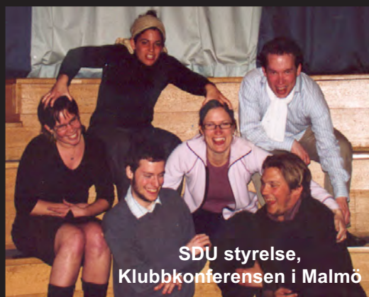
SDU styrelse, Klubbkonferensen i Malmö