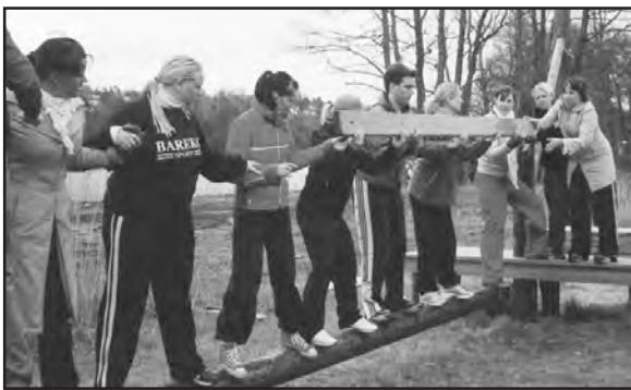
Samarbetsövning på Ånnaboda

På lördagen åkte gruppen till en simhall i Åkeshov utanför Stockholm där de hade livräddningsövningar. Därefter delades deltagarna upp i grupper för att planera inför sommarens läger.