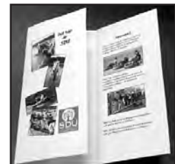
SDU:s informationsbroschyr - Här är SDU