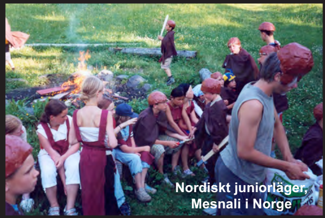
Nordiskt juniorläger, Mesnali i Norge