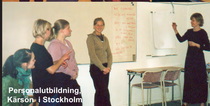
Personalutbildning, Kärnsön i Stockholm