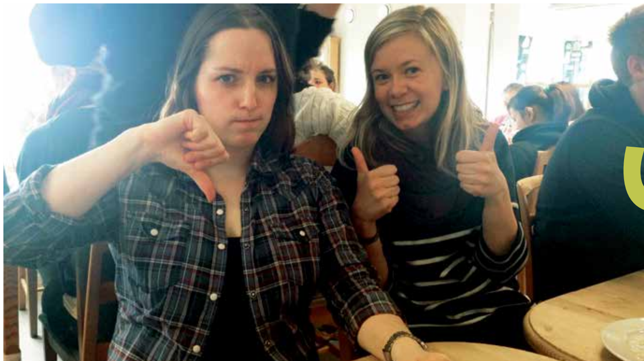
Men den vegetariska maten blev både dissad och hissad!