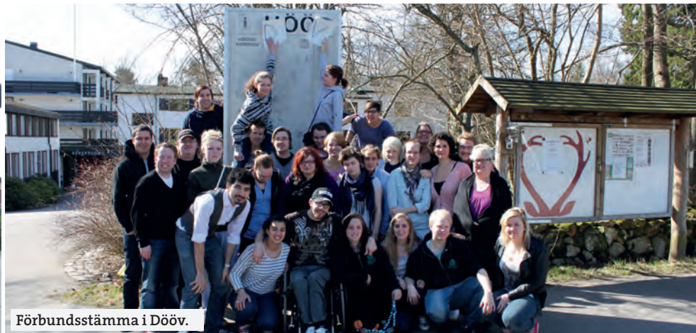
Förbundsstämma i Dööv.