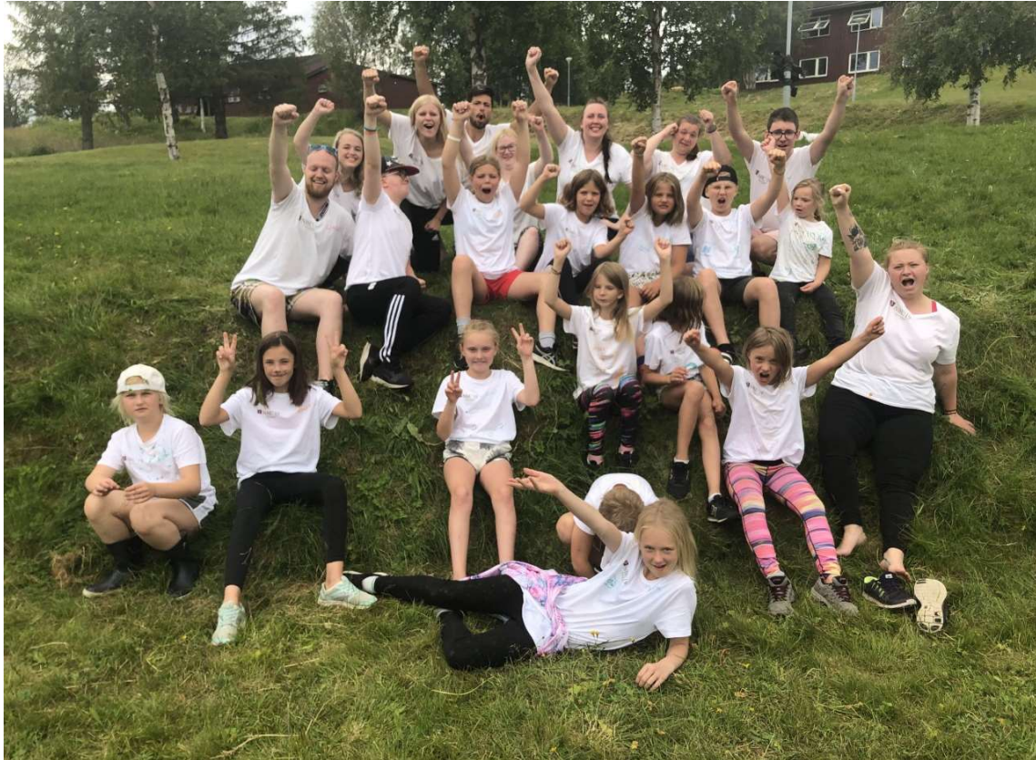
7-12 juli, Nordiskt Barnläger, Ål, Norge Smörgåsar, brunost, Bellmanshistorier

Den 7 juli var vi ett gäng som var förväntningsfulla inför vår resa till Nordiskt Barnläger i Ål i Norge! Vi har fått höra mycket om vårt grannland, om deras smörgåsluncher, brunost och en massa Bellmanshistorier där normännen var mindre smarta... Men det här gänget gapade stort när vi fick se den fina norska naturen. Geografiskt sett så ligger Norge nära oss men på plats kändes det som om vi var i ett sagoland. Varje morgon i sagolandet inleddes med en nationalsång i samband med flaggupphissning för olika länder i Norden. En fantastisk känsla och samhörighet! Under lägerveckan hann vi bland annat med att besöka ett lekland, badhus, 6-kamp, workshop om naturen, kulturkväll med en massa gott och grillmiddag i en tältkåta med en enastående utsikt över bergen. Naturligtvis också massor av lekar både utomhus och inomhus! Tack för en fantastisk vecka!