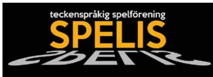
Spelis - Malmö