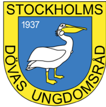
SDUR - Stockholms Dövas Ungdomsråd