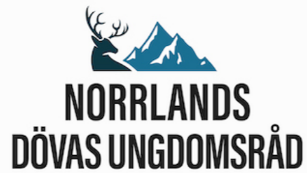
NDUR - Norrlands Dövas Ungdomsråd (Tidigare: NU - Norrlands Ungdomsklubb)