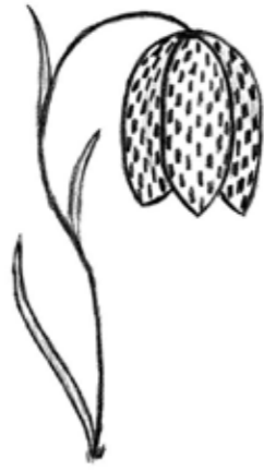
KUL - Kungsängsliljan (Uppsala)