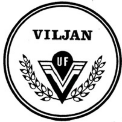
UF Viljan - Ungdomsföreningen Viljan (Vänersborg)