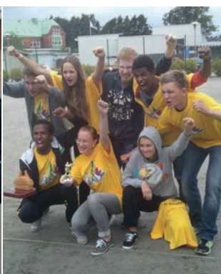
NDUR vinnare av Stadskampen 2012.