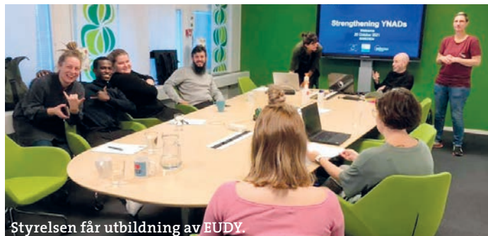
Styrelsen får utbildning av EUDY.

● EUDY (European Union of the Deaf Youth) har ett projekt som heter ”Strengthening YNADs” där de besöker sju utvalda EUDY-medlemsländer och har workshop med ländernas respektive dövungdomsorganisation, dess styrelse och medlemmar om hur vi ska stärka våra organisationer. SDUF är en av de sju som är med i projektet. Till workshoppen skickade vi fem personer från förbundsstyrelsen och två från kansliet. Vi fick bra information och verktyg för hur vi ska tänka kring prioritering i vårt interna arbete. Eftersom inga medlemmar var med under dessa dagar, kommer vi att ordna en förenklad men liknande workshop under förbundsstämohelgen tillsammans med våra ombud. Detta för att få feedback på vad SDUF ska prioritera framöver.