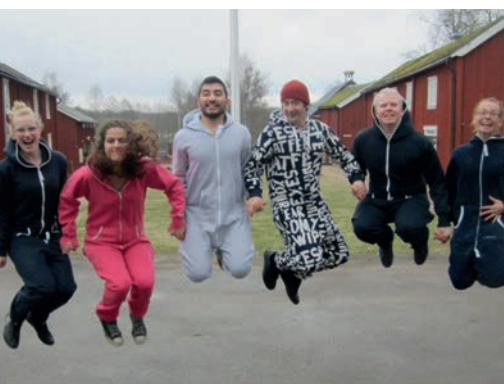
SDUF:s förbundsstämma med ÖDU.