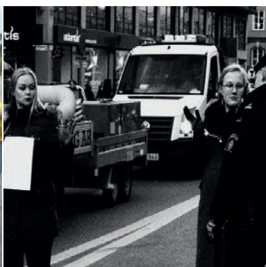
Civil olydnad, Sveavägen 2015.