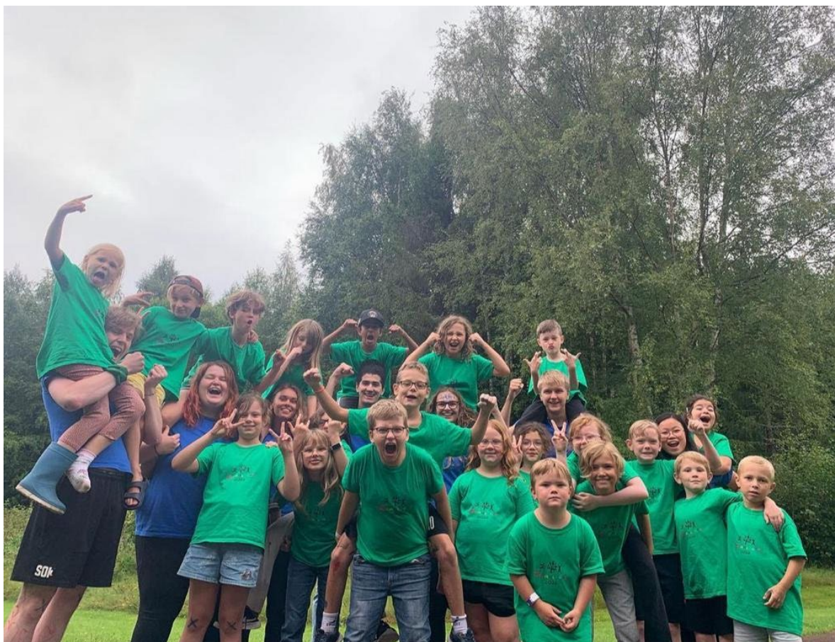
Barnläger 2023, Leksand i Dalarna