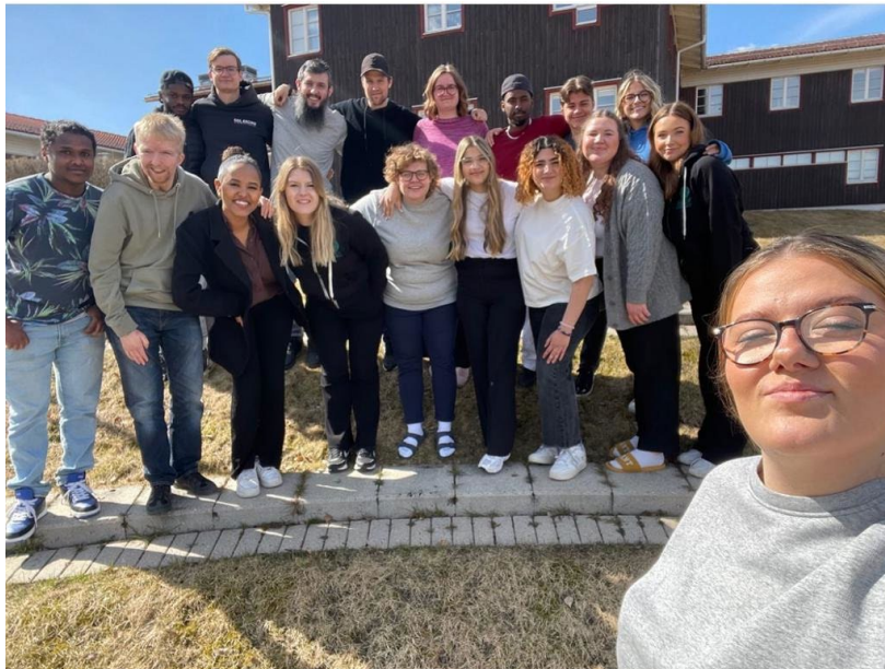
Ungdomsklubbskonferens 2.0 2023, Leksand